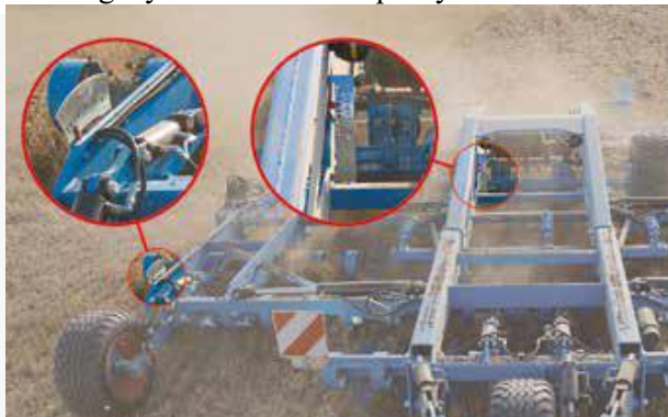
plynulé hydr. nastavenie prac. hĺbky z kabíny