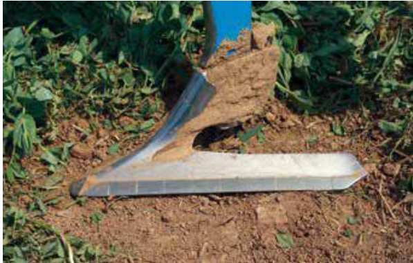
3 rady šípových radlíc šírky 380 mm - podrezanie organických zvyškov - kapilárne pôsobenie, vodná bilancia