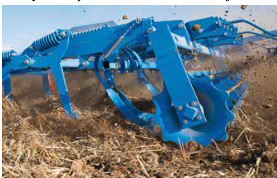
Nivelačná brána za radlicami