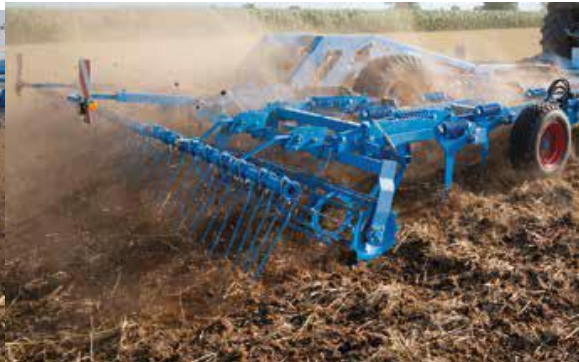
kombinácia valca a jednoradej brány