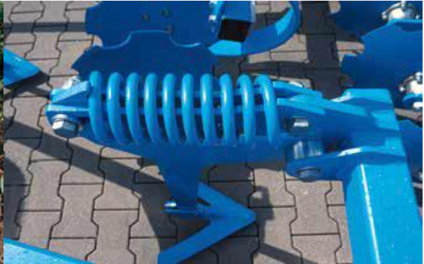
non-stop pružinové istenie - celoplošné spracovanie