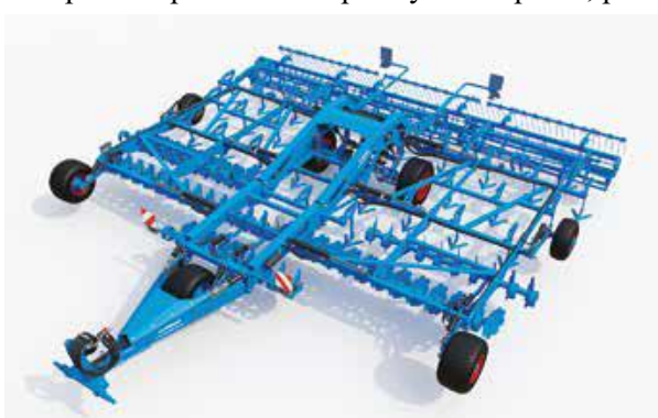
Presná prac. hĺbka pomocou polonesených oporných kolies. - nový koncept hĺbkového vedenia stroja