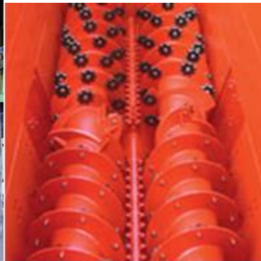
Protibežné šneky + protiostrie