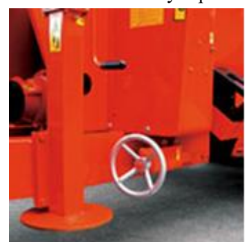
odstavná noha + ručná brzda