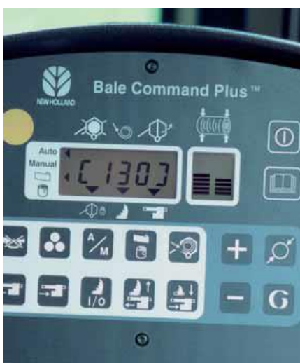
Kabinový monitor ovládania