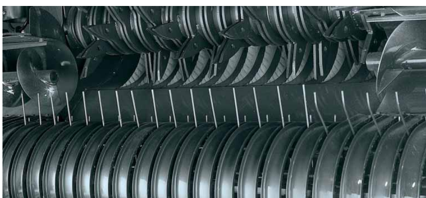
Rotorový vkládač, prsty rozostavené do tvaru „W“, priemer 465 mm, bočné šneky, nože sú vysunuté v pracovnej polohe, každý nôž je istený